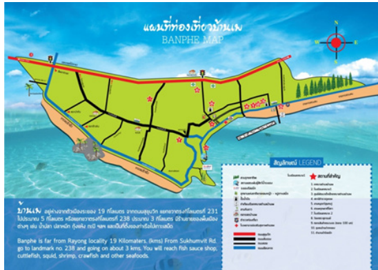
ภาพที่ 1 ขอบเขตพื้นที่รับผิดชอบของตำบลเพ อำเภอมือง จังหวัดระยอง (ที่มา: http://www.banphecity.go.th/ )

เสมีต-เขาแหลมหญ้า โดยมีชุมชนบนเกาะคือ หมู่ 4 ตำบลเพ อำเภอมือง จังหวัดระยอง เพียงหมู่เดียว