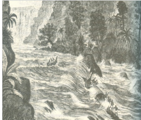
ภาพที่ 1 เส้นทางสู่เมืองลำปางในเดือนพฤษภาคม ภาพที่ 2 การเดินทางล่องแม่น้ำปิงในช่วงเดือนพฤษภาคม พ.ศ.2425 ของคาร์ล บ็อค พ.ศ.2425 ของคาร์ล บ็อค