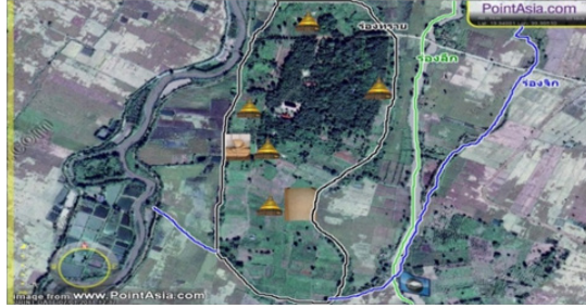
ภาพที่ 3 แผนที่วัดเวียงเชียงรุ่ง

ปัจจุบันเวียงเชียงรุ่งตั้งอยู่ที่บ้านห้วยเคียน หมู่ 10 ตำบลทุ่งก่อ อำเภอเวียงเชียงรุ่ง จังหวัดเชียงราย จากการสำรวจของหน่วยศิลปากรในเขตพื้นที่อำเภอเวียงชัยและอำเภอพญาเม็งราย ซึ่งมีพื้นที่ติดต่อกับอำเภอเวียงเชียงรุ่ง ได้พบเมืองโบราณเป็นจำนวนมาก เช่น ในเขตอำเภอเวียงชัยมีประมาณ 28 เมือง โดยเฉพาะในเขตตำบลทุ่งก่อมีถึง 5 เมือง (ยังไม่นับเวียงเชียงรุ่ง) ในเขตอำเภอพญาเม็งรายมีประมาณ 10 เมือง เมืองโบราณที่พบมีลักษณะคล้ายคลึงกับเวียงเชียงรุ่ง คือส่วนใหญ่ตั้งอยู่บนเนินน้ำท่วมไม่ถึง เป็นเมืองที่มีคูน้ำคันดินและอยู่ใกล้แหล่งน้ำ นอกจากนั้นในแต่ละเมืองยังพบซากโบราณสถาน และเครื่องมือเครื่องใช้แบบเดียวกันโดยเฉพาะ เครื่องใช้ในชีวิตประจำวันในกลุ่มเครื่องปั้นดินเผา ซึ่งมีทั้งชนิดเคลือบและไม่เคลือบ รวมทั้งกลองยาสูบด้วย เป็นต้น (Thongchai, 2011: Appendix 7)