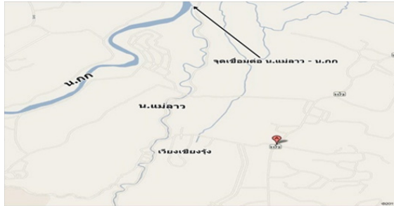
ภาพที่ 5 แผนที่แสดงจุดเชื่อมระหว่างแม่น้ำกกและแม่น้ำลาว

สันนิษฐานว่าเวียงเชียงรุ่ง คงจะทำหน้าที่เป็นเมืองเชื่อมต่อกับเมืองต่างๆ ทั้งภายในและภายนอกพื้นที่เช่นเดียวกัน ทั้งนี้เพราะเวียงเชียงรุ่งตั้งอยู่ริมฝั่งแม่น้ำลาว และอยู่ห่างจากบริเวณสบกกเพียง 2500 เมตร (Ditsayadet et al., 1982 : 3) เท่านั้น สบกกคือบริเวณที่แม่น้ำลาวไหลลงแม่น้ำกกซึ่งเป็นแม่น้ำที่เชื่อมต่อระหว่างเชียงรายกับเชียงแสน ฉะนั้นพื้นที่นี้จึงเป็นพื้นที่สำคัญที่เป็นแหล่งรวมของกลุ่มคนที่เดินทางมาตามลำน้ำทั้งสอง