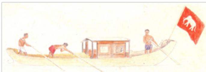
ภาพที่ 4 เรือที่คาร์ล บ็อคใช้ในการเดินทางเชียงแสน (Fine Arts, Department, 1987: 1)

เชียงแสน เป็นประตูเข้าออกไปยังกลุ่มหัวเมืองตอนบนคือ ยูนนาน ลีปสอง พันนา และกลุ่มหัวเมืองไทยใหญ่ เป็นต้น ดังจะเห็นได้จาก เมื่อคาร์ล บ็อค ต้องการเดินทางไปเชียงตุง เขาต้องเดินทางผ่านเชียงแสน จึงเข้าไปขออนุญาตเจ้าเมืองเชียงราย