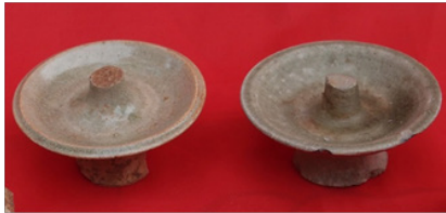
ภาพที่ 6 ตะเกียงแขวน พบที่วัดเวียงเชียงรุ่ง กลุ่มเตาล้านนาที่ผลิตตะเกียงแขวนมาก คือ กลุ่มเตापาน และเวียงกาหลง

2.2 ตะเกียงแขวน เครื่องปั้นดินเผากลุ่มนี้พบเป็นจำนวนมาก ส่วนใหญ่เป็นของกลุ่มเตापาน ตะเกียงเหล่านี้อาจจะใช้ในบ้านของผู้มีฐานะหรือวัดก็ได้ แต่แสงไฟจากเครื่องปั้นดินเผาเหล่านี้แสดงให้เห็นถึงการมีชุมชนอาศัยอยู่ในพื้นที่ และเป็นจุดหมายของคนเดินทางที่ผ่านไปมาในช่วงเย็นถึงค่ำได้แวะพักก่อนเดินทางต่อไปในวันรุ่งขึ้น