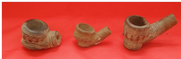
ภาพที่ 7 กล้องยาสูบ พบที่วัดเวียงเชียงรุ่ง กล้องยาสูบแบบนี้พบทั่วไปในเมืองต่างๆ ภายในอาณาจักรล้านนา แต่ปัจจุบันยังไม่ทราบว่ากล้องยาสูบเหล่านี้มีแหล่งผลิตอยู่ที่ใดแน่

2.3 กล้องยาสูบหรือกล้องบุยา ในรายงานของ เฮอร์เบิร์ต วาริงตัน สมิท นักธรณีวิทยาชาวอังกฤษที่เข้ามาในล้านนาในสมัยรัชกาลที่ 5 กล่าวว่า พวกที่ใช้กล้องยาสูบเหล่านี้เป็น “...พ่อค้าที่มาจากทางเหนือคล้ายชาวพม่า พวกเขาสูบยาจากกล้องยาวๆ สวมกางเกงสีน้ำเงิน...” (Thongtan, 2001: 55)