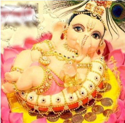
ภาพที่ 1 ปางบรมสุขสารพัดนึก