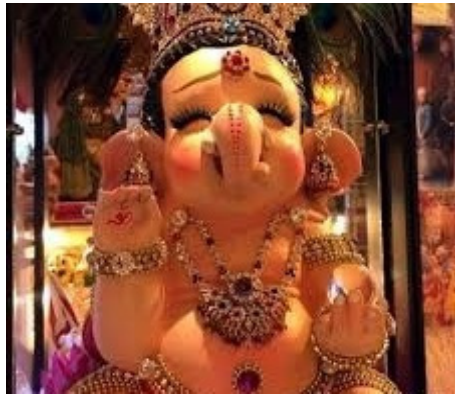
ภาพที่ 2 ปางถือแก้วสารพัดนึก