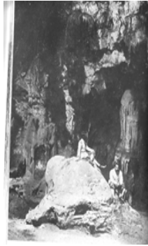
ภาพที่ 1 สมเด็จพระยาดำรงราชานุภาพ ทรงฉายภาพภายในถ้ำที่เพชรบุรี (Damrong Rajanubhab, 2002)