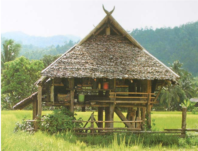
ภาพที่ 4 ห้างนาภาคเหนือ