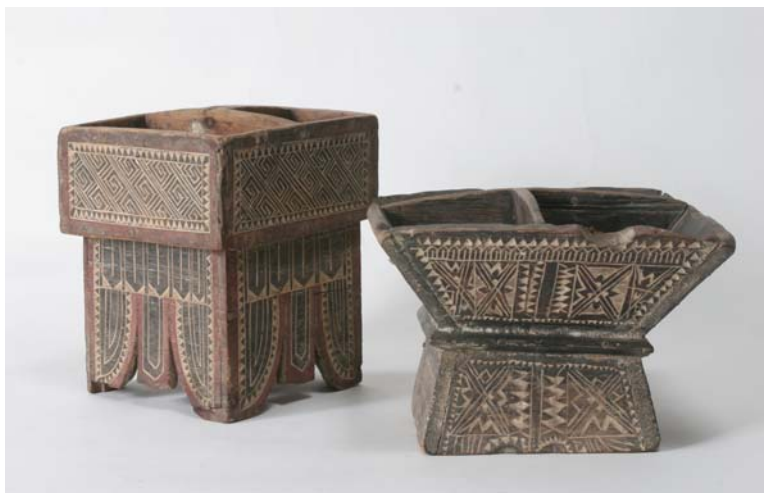
ภาพที่ 1 เชี่ยนหมากไม้ภาคอีสาน