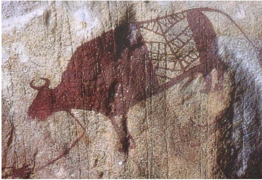
ภาพที่ 3 จิตรกรรมฝาผนังสมัยก่อนประวัติศาสตร์