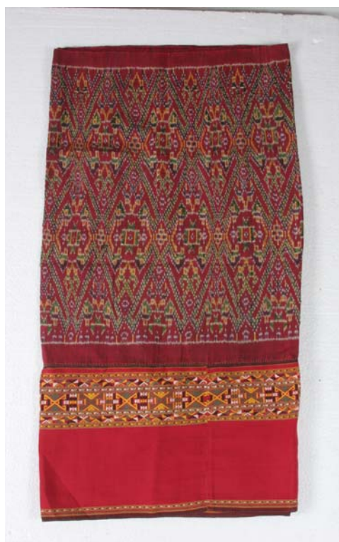
ภาพที่ 2 ชิ้นตีนจก อุทัยธานี