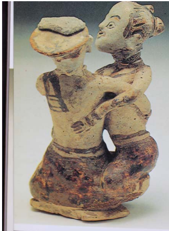
ภาพที่ 7 ตุ๊กตาสังคโลก