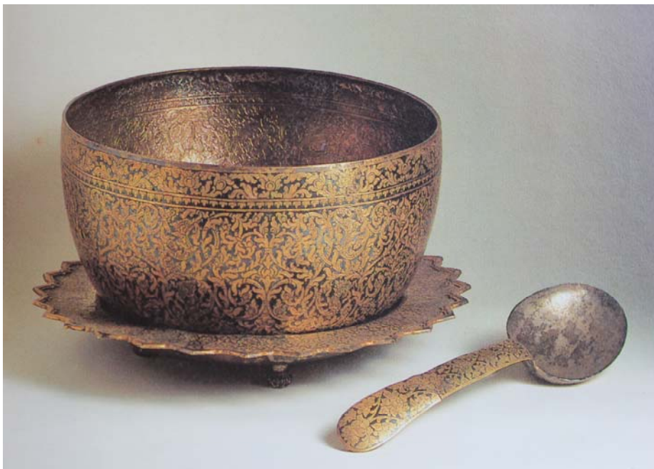
ภาพที่ 6 ขันถมทอง