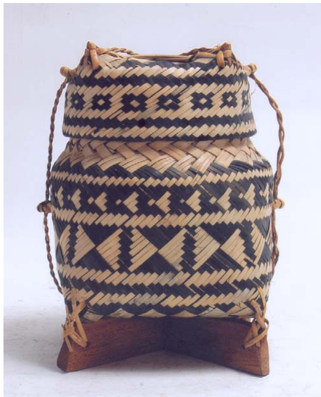
ภาพที่ 9 ก่องเข้า บ้านเมืองมาย อำเภอแจ้ห่ม จังหวัดลำปาง