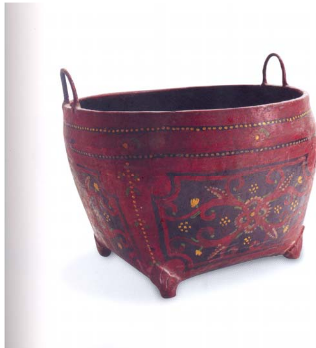
ภาพที่ 8 บุง เครื่องรักภาคเหนือ