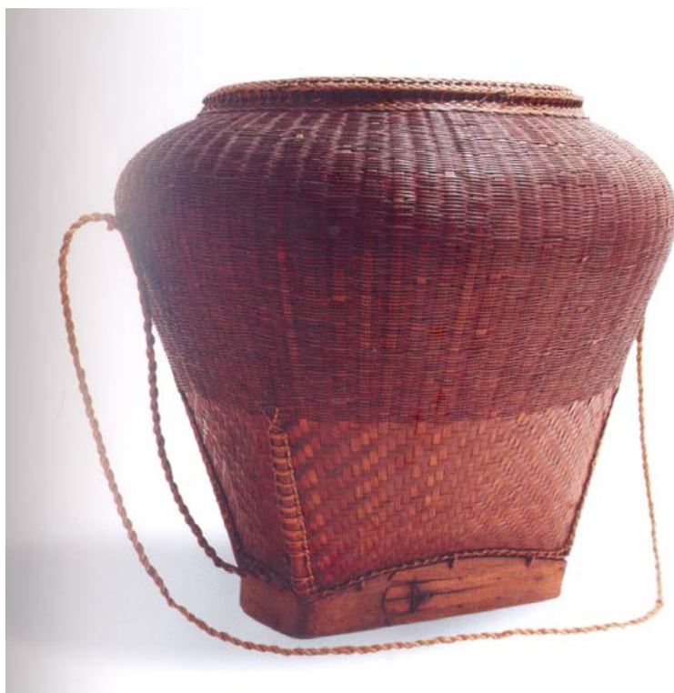
ภาพที่ 10 กะเหล็บ ชาวไทโซ่ง อำเภอบางเลน จังหวัดนครปฐม